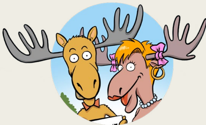
Elga e Alcide

Elga e Alcide sono i due personaggi che popolano le vignette che accompagnano questa pubblicazione. Se li guardi bene, ti accorgerai che hanno le sembianze di un alce. Un animale nobile che, nonostante porti sulla sua testa il peso del grande palco, cammina fiero e a testa alta.